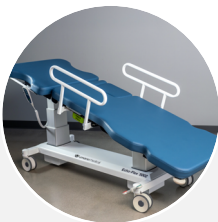
Trendelenburg et Trendelenburg inversé ± 15°

Le revêtement en vinye est testé pour les produits de nettoyage courants utilisés dans les hôpitaux et les cliniques 1 , ce qui est impératif lorsque le contrôle des infections est une priorité.