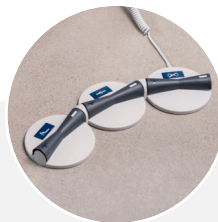
Contrôle au pied* Hauteur, position du dossier, Trend et Trend inv.