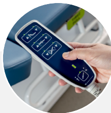
Commande à main rétroéclairée facile d'utilisation