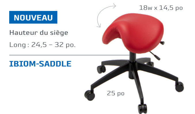
HS PONY SADDLE 200 FR

NOUVEAU Hauteur du siège Long: 24,5 - 32 po.